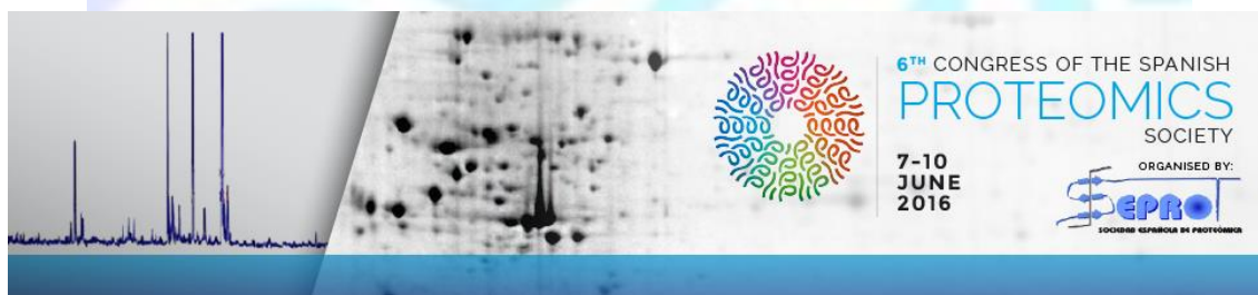
Ángel García – Presidente de la SEProt

La elección de los ganadores correspondientes a las contribuciones en formato panel y oral presentadas al 6º Congreso de la SEProt se efectuará entre los primeros firmantes de los estudios por un jurado designado a tal efecto por el Presidente de la Sociedad Española de Proteómica. Solo podrán optar al Premio científicos españoles, sean o no socios de la SEProt. La labor investigadora considerada deberá haber sido realizada en España y ser inédita o, en todo caso, no haber sido publicada con anterioridad al 31 de diciembre de 2015.